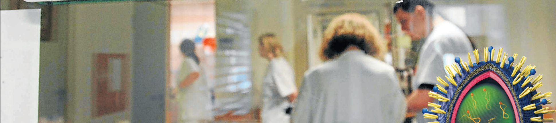
Mindestens 2000 Betten werden bei einer Influenza-Pandemie für Grippe-Kranke in Münchner Krankenhäusern erforderlich sein